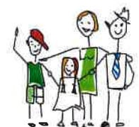
Lokales Bündnis für Familie Anhalt-Bitterfeld